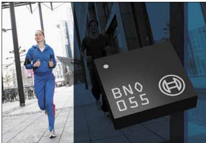
Рис. 3. BNO055 — первый сенсорный узел, специфицированный согласно применению