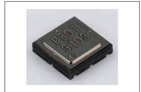
Рис. 10. Новый высокоточный МЭМС-датчик абсолютного давления Omron

В свое время (года два назад) к инновационным применениям относились, например, 3D-навигация и сервисы, основанные на местоположении (Location-Based Services, LBS), в которых были востребованы датчики давления для мобильных измерений высоты. А сегодня датчики давления уже применяются в High-End смартфонах и представляют собой весьма развитую коммерческую технологию [4]. STMicroelectronics, например,