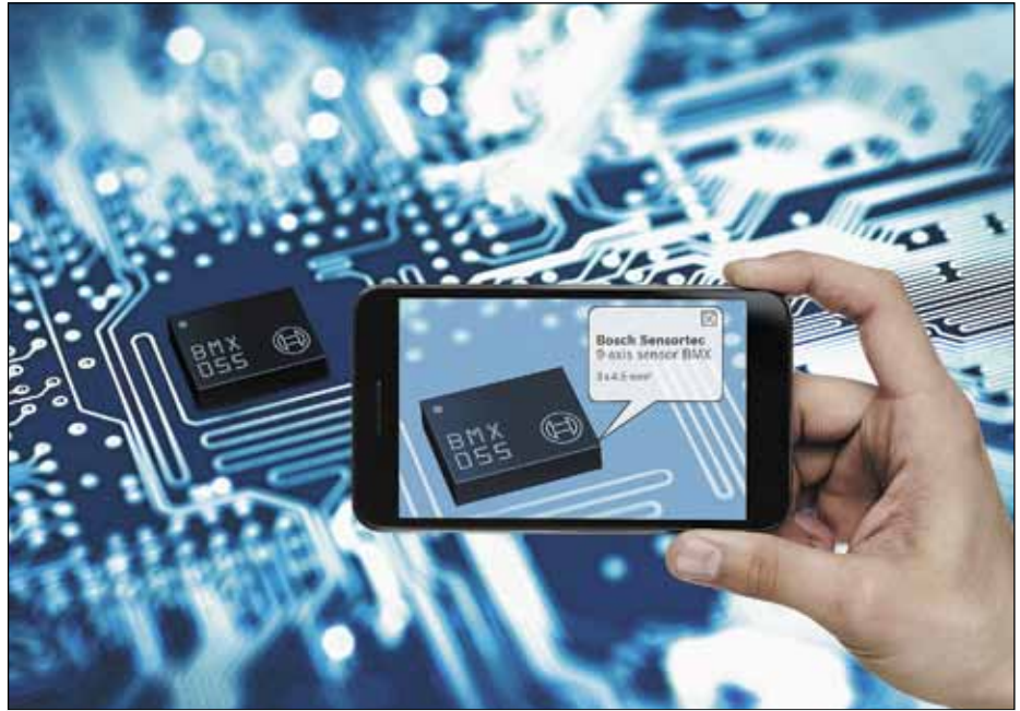
Рис. 2. BMX055 — первый 9-осевой полностью интегрированный абсолютный датчик ориентации от Bosch