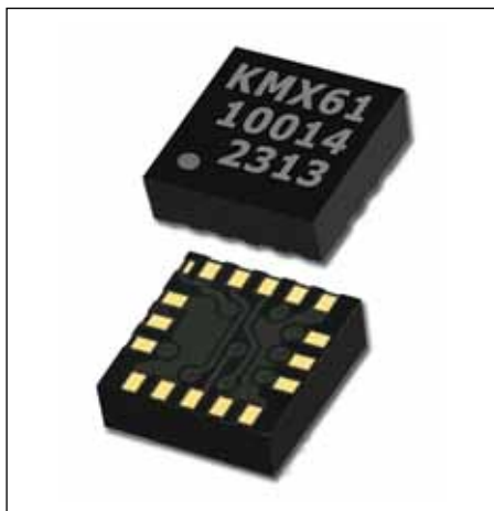
Рис. 1. Инновационный магнитный гироскоп KMX61G

Программные средства для сенсорного слияния сделали возможной высокоточную эмуляцию гироскопа, вдобавок со значительно сниженным потреблением мощности до уровня 550 мкА. Заявленное снижение мощности по сравнению со стандартными гироскопами — порядка 80–90%. «Сильная» аппаратная часть, обеспечивающая высокие рабочие характеристики, и инновационное ПО KMX61G вместе с потреблением тока на уровне микроампер позволяют компании Kionix позиционировать свой новый про-