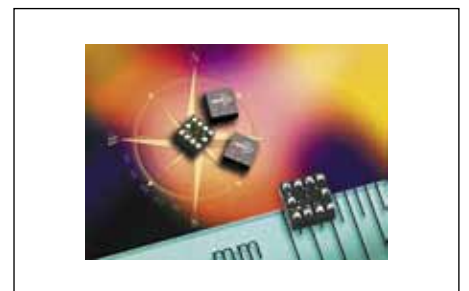
Рис. 7. Внешний вид магнитометров MEMSIC: 3-осевой датчик MMC3316xMT и 2-осевой датчик MMC246xMT

А в июне 2013 года компания представила свой следующий магнитометр — 2-осевой датчик MMC246xMT (рис. 7) [6].