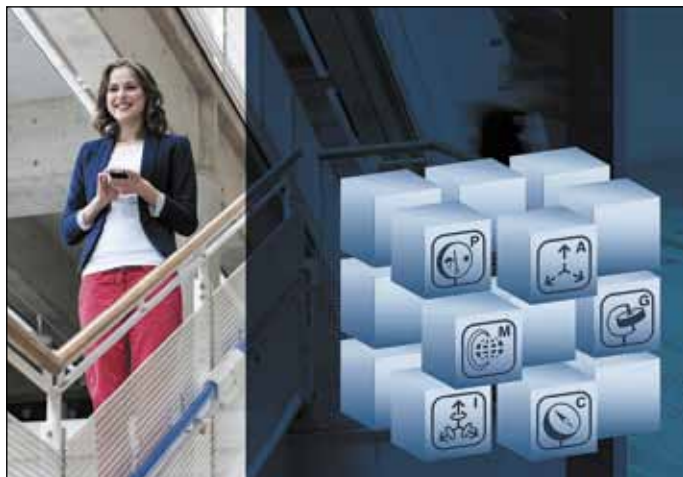
Рис. 4. Новое поколение ПО для интеллектуального слияния строчных сенсорных данных Bosch Sensortec FusionLib BSX3.0

нулевой угловой скорости). Геомагнитный датчик также характеризуется широким измерительным диапазоном в \pm 1300 мкТл по осям X и Y и \pm 2500 мкТл по оси Z. Курсовая точность составляет 2,5^\circ .