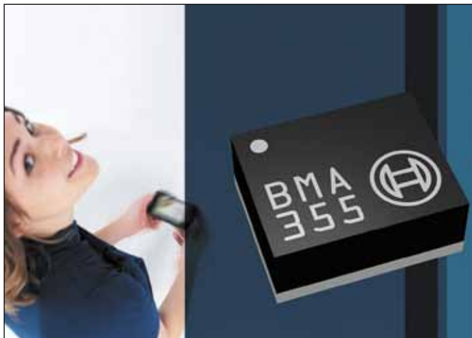
Рис. 8. ВМА355 — самый малый 3-осевой MEMS-акселерометр от Bosch

ВМА355 (рис. 8) — это новый MEMS-датчик Bosch в WLCSP-корпусе (wafer-level chip scale package — корпус масштаба кристалла на уровне пластины), характеризующийся размерами всего 1,2×1,5×0,8 мм. Эти размеры даже меньше, чем у 2-осевого цифрового акселерометра MXC6226XC на основе тепловой технологии MEMSIC, имеющего размеры 1,2×1,7×1 мм, которые с 2011-го и практически до конца 2012 года считались непревзойденными [7, 8]. Теперь корпус ВМА355 является самым малым (причем не 2-осевым, как MXC6226XC, а 3-осевым) MEMS-акселерометром на рынке на момент его представления на мероприятии CES 2013 года. Такие размеры позволяют разработчикам без ограничений встраивать функциональность 3-осевого акселерометра в системы с ограниченным пространством.