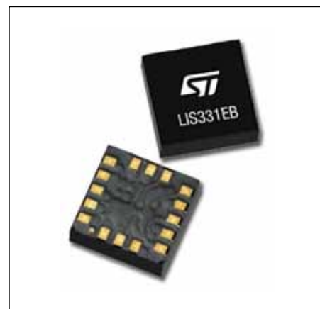
Рис. 5. Новый 3-осевой акселерометр ST LIS331EB, интегрированный с МК

Автономное устройство понижает требования к центральному процессору и/или процессору применения и позволяет уменьшить потребление мощности в портативных устройствах. Оба преимущества дают большую свободу и гибкость дизайнера потребительской электроники, в которой используется интеграция функций, основанных на обнаружении движения. Диапазон применений включает носимые устройства, функции пользовательского интерфейса в смартфонах и планшетах и дополненную реальность. Интеграция 3-осевого высоко-разрешающего датчика линейного движения и сенсорного узла в одном корпусе повышает системную прочность и способствует оптимизации схем на плате.